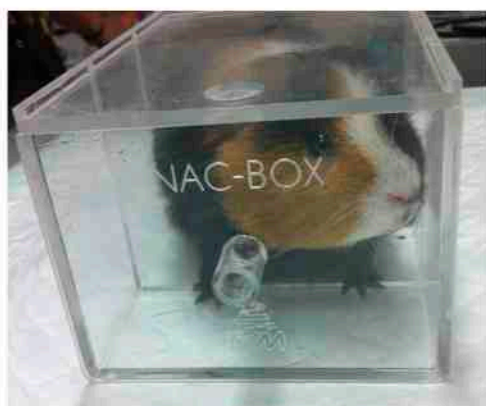
NAC-Box pour l'induction de l'anesthésie

L'entretien de l'anesthésie est réalisé par le biais d'un masque sur la tête de l'animal.